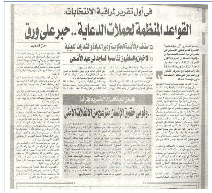
Similar news was covered in al-Dustour, p.5; al-Tahrir, P. 6; al-Akhbar, p. 6.

The Elections Unit at the National Council for Human Rights reported on 8362 demands submitted to the High Electoral Commission to issue observation licenses to proxies of 75 associations in 20 governorates. The report expected a number of 20,000 national observers. It was also reported that the Electoral Unit trained 840 observers from 40 associations in 36 training sessions.