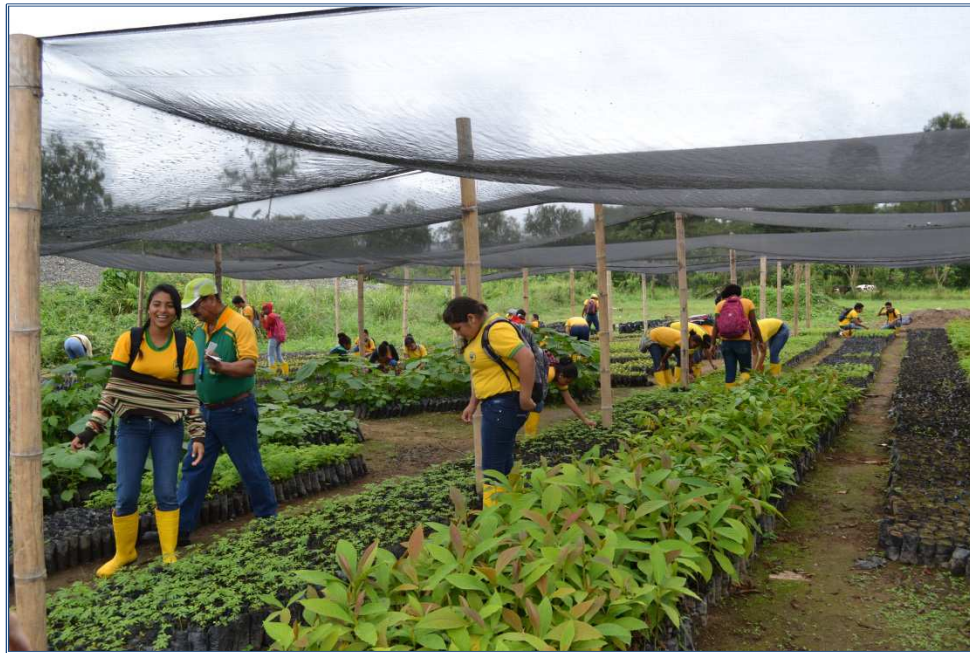
Colegio Agropecuario en el Cantón Quinindé