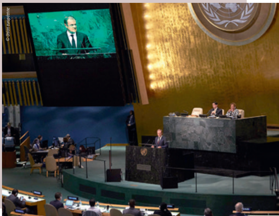
Donald Tusk, président du Conseil européen, prenant la parole devant l'Assemblée générale des Nations unies (septembre 2015)

en 2015, l'UE a fait 55 déclarations à l'OIT lors de la 104 e session de la Conférence internationale du travail, lors des 323 e , 324 e et 325 e sessions du conseil d'administration ainsi que lors de deux réunions tripartites. L'UE et ses États membres ont appuyé les principes et droits fondamentaux au travail, le développement durable, la protection du travail, notamment contre les formes inacceptables de travail, ainsi que le suivi des progrès réalisés. Ils ont évoqué les violations des normes fondamentales du travail en Érythrée, en Mauritanie, au Myanmar/en Birmanie et au Qatar, pour ce qui concerne le travail forcé, au Cambodge et au Cameroun, pour ce qui concerne le travail des enfants, et au Bangladesh, en Biélorussie, aux Fidji, au Guatemala et au Swaziland, pour ce qui concerne la liberté d'association. Par ailleurs, l'UE a soutenu fermement les travaux du mécanisme de contrôle unique de l'OIT.