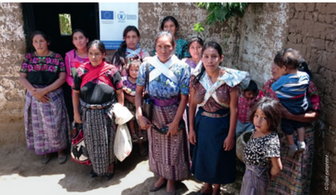
Des mères appartenant au peuple autochtone quiché au nord du Guatemala

Comme le prévoit le plan d'action de l'UE en faveur des droits de l'homme et de la démocratie, l'UE a commencé à élaborer une politique renforcée sur les questions autochtones, dans le prolongement de la déclaration des Nations unies sur les droits