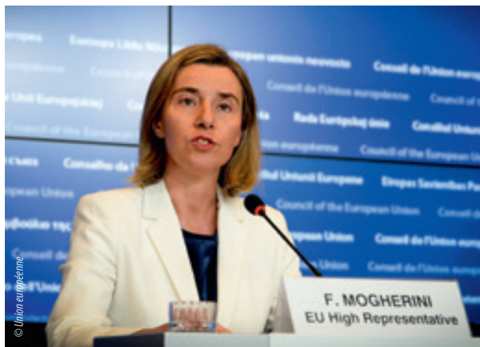
Federica Mogherini lors de la session du Conseil des affaires étrangères du 20 juin 2016, lorsque la partie thématique du rapport annuel a été adoptée

Bien entendu, il était impossible, en rédigeant le rapport, de ne pas tenir compte du fait que 2015 a été une année particulièrement difficile pour les droits de l'homme dans l'Europe elle-même et dans son voisinage. La crise des réfugiés a mis à l'épreuve la responsabilité de l'Europe en tant qu'acteur mondial, ainsi que sa capacité à se montrer à la hauteur des valeurs qu'elle défend. Nous devons plus que jamais placer les droits de l'homme au centre de notre action: nous sommes appelés à faire preuve de solidarité afin de gérer judicieusement et humainement, en coopération avec tous nos partenaires, l'afflux actuel de réfugiés, d'une ampleur extraordinaire. En 2015, nous nous sommes accordés à reconnaître que des mesures nationales seules sont inefficaces: nous devons maintenant nous orienter progressivement vers une approche véritablement européenne et mondiale de la mobilité humaine au XXI e siècle, en mettant en concordance nos politiques intérieures et extérieures et en veillant à ce qu'elles soient cohérentes.