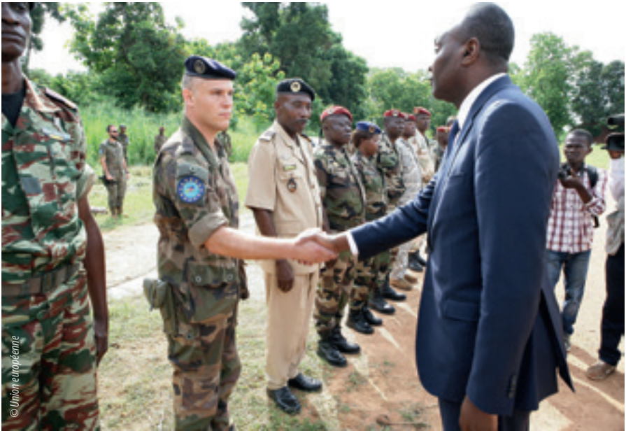
Joseph Yakété, ministre de la défense de la République centrafricaine, au camp Kasai, la base de la mission de conseil militaire de l'UE (EUMAM RCA), à Bangui

En novembre 2015, le Conseil a adopté les conclusions sur le soutien de l'UE à la justice transitionnelle (9) . Ce faisant, l'UE est devenue la première organisation régionale dotée d'une stratégie consacrée à la justice transitionnelle. Le cadre d'action en question fait apparaître l'importance que l'UE attache à cette question, renforce la cohérence de l'action menée par l'UE en la matière et fournit des orientations au personnel de l'UE et de ses États membres.