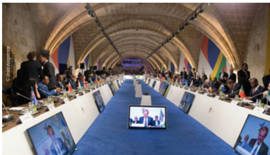
Table ronde de la deuxième session de travail lors du sommet de La Valette de 2015 sur la migration

Face à ce formidable défi, l'UE s'est efforcée de faire en sorte que la protection des droits de l'homme constitue une priorité de son action. Le Conseil européen, dans sa déclaration du 23 avril 2015 (13) et dans ses conclusions des 25 et 26 juin 2015 (14) , est convenu de la nécessité de réagir rapidement et efficacement face à la crise humanitaire, tout en élaborant une stratégie à moyen et long termes et en intensifiant la coopération avec les pays tiers d'origine et de transit. L'agenda européen en matière de migration (15) , adopté par la Commission européenne en mai, fait du respect des droits de l'homme une priorité dans chacun des domaines d'action. Les dirigeants africains et européens réunis au sommet de La Valette à Malte les 11 et 12 novembre 2015 ont souligné qu'il était important de protéger les droits de l'homme des migrants,