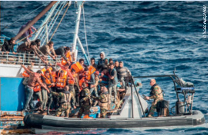
Force navale de l'Union européenne - Méditerranée. Opération SOPHIA

de l'élimination de la traite des filles et des femmes, toutes formes d'exploitation confondues, l'une de ses priorités. Lors du sommet de La Valette, les dirigeants politiques se sont en outre engagés à apporter une protection, un soutien et une assistance aux victimes de la traite, en accordant une attention particulière aux groupes vulnérables, tels que les femmes et les enfants.