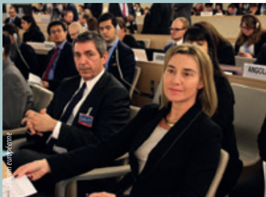
Federica Mogherini et Stavros Lambrinidis à l'ONU, à Genève (mars 2015)

Nommé en 2012, le RSUE pour les droits de l'homme, Stavros Lambrinidis, a continué à œuvrer — sous l'autorité de la haute représentante de l'Union pour les affaires étrangères et la politique de sécurité — à l'accroissement de la cohérence, de l'efficacité et de la visibilité des droits de l'homme dans la politique étrangère de l'UE. En 2015, l'accent a été mis sur l'intensification du dialogue sur les droits de l'homme mené entre l'UE et les partenaires stratégiques ayant une forte présence aux niveaux régional et multilatéral, le RSUE se rendant à son tour au Brésil, en Chine, au Mexique et en Afrique du Sud; sur l'importance accrue accordée au voisinage de l'UE, y compris au moyen de visites effectuées pour la première fois en Azerbaïdjan et au Maroc; sur le maintien des liens solides noués avec certains pays en transition, y compris le Bahreïn et le Myanmar/la Birmanie, et le lancement des premières discussions sur les droits de l'homme avec Cuba; et sur la nécessité de mieux faire connaître l'action menée par l'UE auprès de l'ONU et de mécanismes régionaux dans le domaine des droits de l'homme en vue de favoriser la prise en charge du processus au niveau régional et de promouvoir l'universalité des droits de l'homme, notamment grâce au lancement d'un premier dialogue stratégique sur les droits de l'homme avec les mécanismes des droits de l'homme de l'Association des nations de l'Asie du Sud-Est ANASE et à l'approfondissement de la coopération avec l'Union africaine (UA).