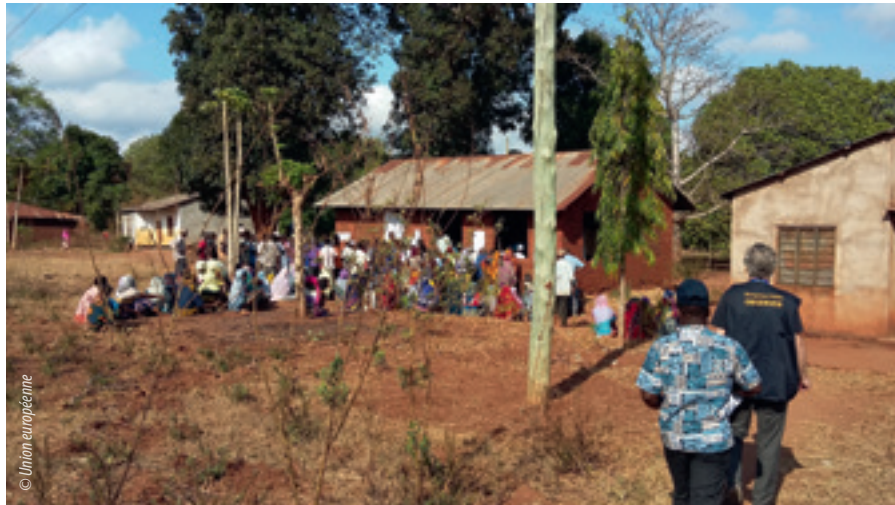
Mission d'observation électorale de l'UE en Tanzanie (octobre 2015)

En 2015, l'UE a continué de soutenir les processus électoraux dans le monde entier en déployant des MOE et des missions d'experts électoraux, ainsi qu'en apportant une assistance technique et financière à des organismes de gestion électorale et à des observateurs nationaux. En 2015, des MOE ont été menées au Burkina Faso, au Burundi (mission retirée en l'absence des conditions minimales indispensables à des élections crédibles), en Guinée-Conakry, à Haïti (toujours en cours), au Myanmar/en Birmanie, au