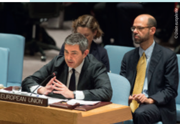
Stavros Lambrinidis, représentant spécial de l'UE pour les droits de l'homme, prononçant une déclaration de l'UE à l'Assemblée générale des Nations unies

mocratie, de la bonne gouvernance, de la résilience, de la cohésion et de la promotion des droits humains fondamentaux» (30) . La haute représentante a aussi demandé que de nouveaux efforts soient déployés afin de lutter contre les tentatives menées dans de nombreux pays du monde pour contrôler le travail de la société civile.