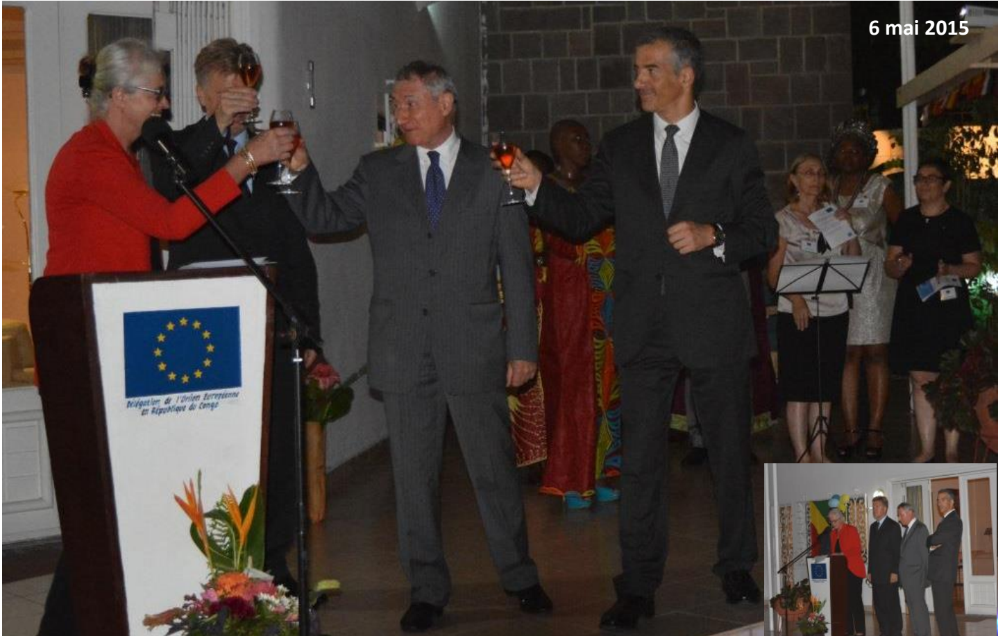
Mme Saskia De Lang, portant un toast avec ses pairs à la santé de l'Union européenne et aux relations UE-Congo

C'est dans une ambiance chaleureuse que s'est déroulée la traditionnelle réception du 9 mai, célébrée à Brazzaville avec 3 jours d'avance. Mme Saskia De Lang dont c'était le premier cocktail en tant qu'Ambassadeur de l'Union européenne au Congo, a reçu ses invités dans le jardin de sa résidence, mercredi 6 mai de 18h à 20h.