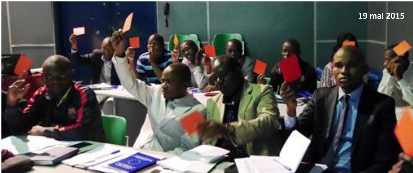
Représentants de la société civile participants à une animation d'échange sur la coopération avec l'UE

La Semaine de l'Europe à l'IFC a démarré par une journée d'information dédiée aux organisations de la société civile congolaise afin d'améliorer leur compréhension des exigences de l'UE relatives aux subventions européennes et à la gestion de celles-ci.