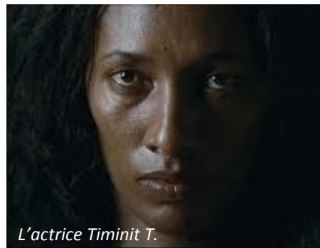
L'actrice Timinit T.

érythréenne qui interprète l'un des personnages principaux avec beaucoup de justesse, est elle-même res-