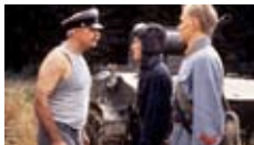
de Nikita Mikhalkov avec Nikita Mikhalkov Comédie dramatique Lituanie, 2h15, 1994