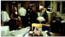
de Mario Azzopardi avec Patsy Kensit Thriller, Drame US, 1h35, 2001