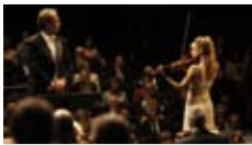
deRadu Mihaileanu avec Mélanie Laurent Comédie dramatique Roumanie, France, 2h, 2009