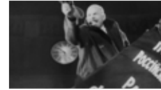
de Sergueï Eisenstein avec Vassili Nikandrov Fresque historique Russie, 1h43, 1927