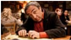
de Carlo Mazzacurati avec Silvio Orlando Comédie Italie, 1h46, 2010