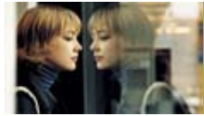
de Lukas Moodysson avec Oksana Akinshina Romance, Drame Danemark, Suède, 1h49, 2003