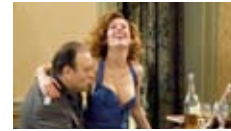
de Paul Verhoeven avec Carice Van Houten Drame, Guerre Pays-Bas, 2h25, 2006