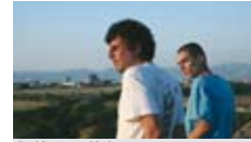
de Kamen Kalev avec Christo Christov Drame Bulgarie, 1h23, 2010