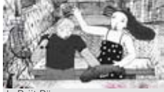
de Priit Pärn Animation Estonie, 0h44