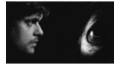
de Bela Tarr, Agnes Hranitzky avec Peter Fritz Drame, Hongrie, 2h25, 2003