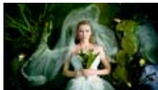
de Lars von Trier avec John Hurt, Kirsten Dunst Science fiction, Drame Danemark, France, 2h10, 2011