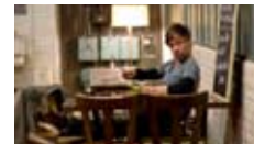
de Fatih Akin avec Adam Bousdoukos, Birol Ünel Comédie Allemagne, 1h39, 2010