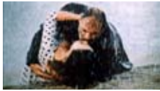
de Théo Angelopoulos avec Bruno Ganz Drame Grèce, France, 2h12, 1998