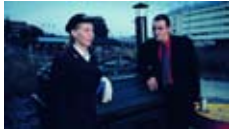
de Aki Kaurismäki avec Markku Peltola Drame Finlande, Allemagne, 1h37, 2002