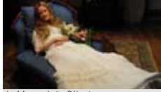
de Manoel de Oliveira avec Pilar López de Ayala Drame Portugal, Brésil, 1h35, 2011