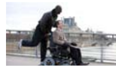
de Eric Toledano, Olivier Nakache avec François Cluzet, Omar Sy Comédie France, 1h52, 2011