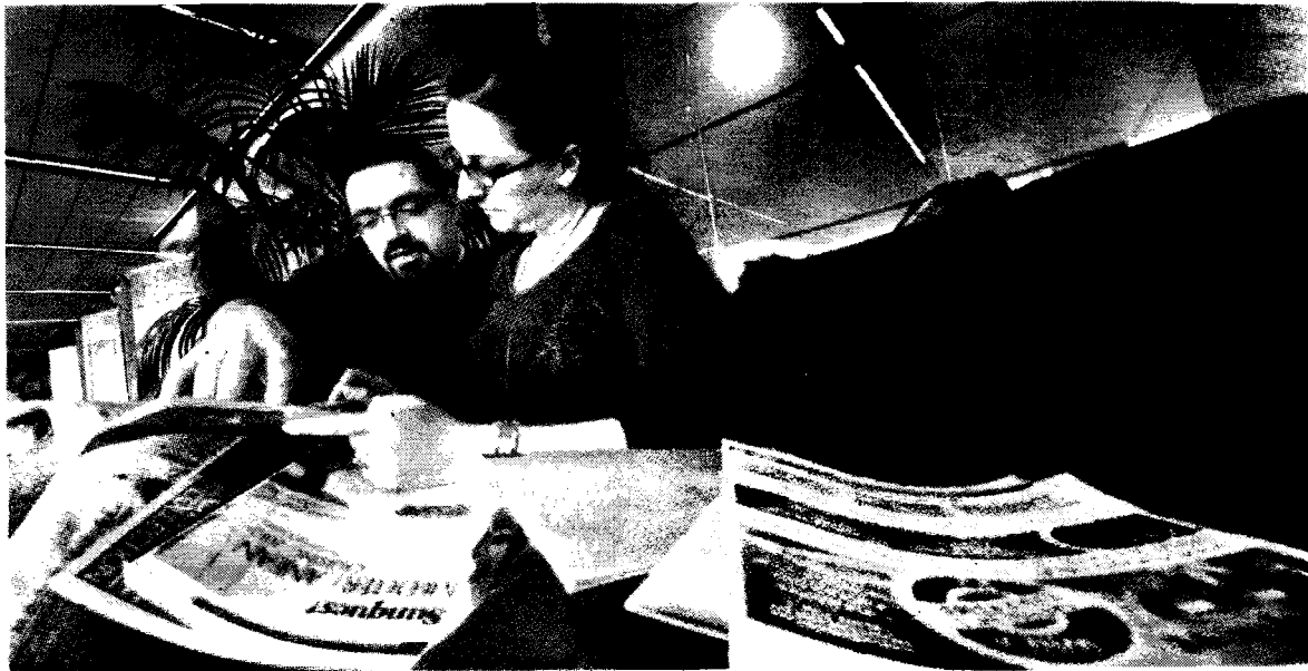
MARTIN ROY, LeDroit

Une cinquantaine de pays se sont affichés cette fin de semaine sur la surface du Centre des congrès d'Ottawa, dans le cadre du 18e salon Vacances et voya-