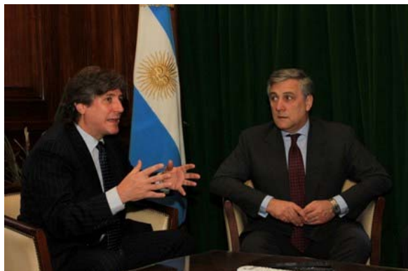
Antonio Tajani con el vicepresidente de la Nación Amado Boudou

Antonio Tajani, Vicepresidente de la Comisión Europea responsable de Industria y Emprendimiento, hizo una visita de trabajo a Buenos Aires para fortalecer los lazos económicos e industriales de la UE con el país y el Mercosur. Anteriormente, Tajani estuvo en Brasil y hoy por la tarde partió para Montevideo, donde asiste, junto con el Presidente del Parlamento Europeo Jerzy Buzek, como representante de la UE en la Cumbre de Mercosur.