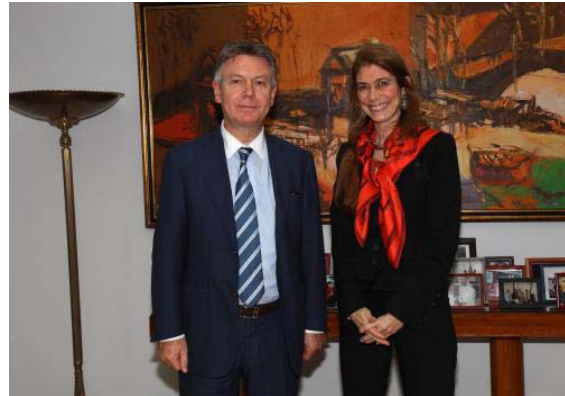
Comisario de Comercio de la UE Karel de Gucht y la Ministra de Industria Débora Giorgi

El 15 de septiembre el Comisario de Comercio de la UE Karel de Gucht se reunió con el Canciller Héctor Timerman y con la Ministra de Industria Débora Giorgi para abordar el proceso de negociación actualmente en curso entre la UE y el Mercosur. Los funcionarios confirmaron su satisfacción por la reanudación de las negociaciones y se comprometieron a avanzar hacia un acuerdo ambicioso y mutuamente beneficioso para las dos regiones.