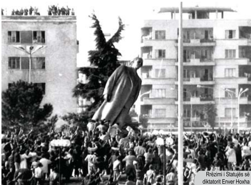
Rrëzimi i Statujës së diktatorit Enver Hoxha

Rënia e Murit të Berlinit hapi portat e lirisë për Shqiptarët.